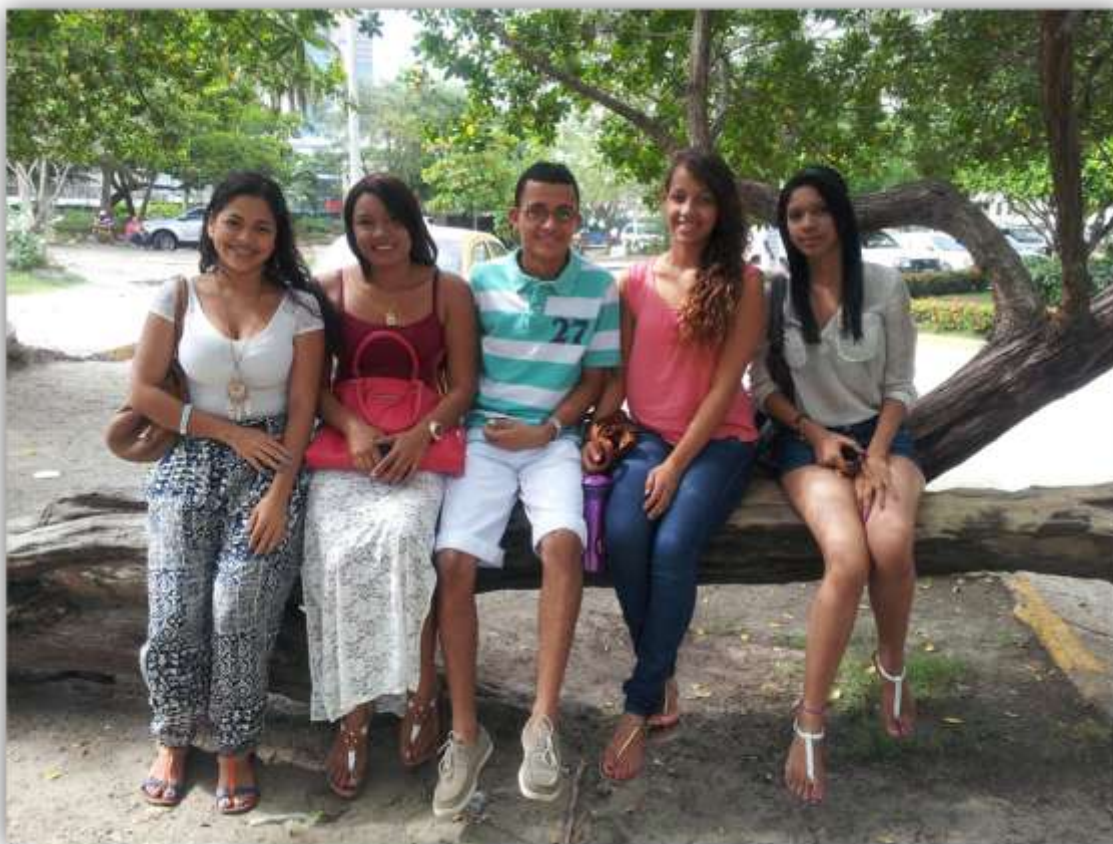
Foto 22. Estudiantes del Semillero SEMISOJU de la Línea Sociedad, Ambiente y Derecho, haciendo un trabajo de campo en el barrio El Laguito.

Estudios y Cursos de Actualización. Buscan corregir las falencias que tienen los lineamientos del currículo universitario, previo diagnóstico que resulte de la evaluación del proceso enseñanza-aprendizaje. Para el desarrollo de esta actividad, se programan varios Seminarios Talleres, como los de Oratoria y Expresión oral, el de Investigación con Medios Audiovisuales con énfasis en Fotografía y Lecto-escritura, entre otros, los cuales son útiles para orientar la producción intelectual en cada grupo de Semilleros de la UNIVERSIDAD LIBRE sede Cartagena.