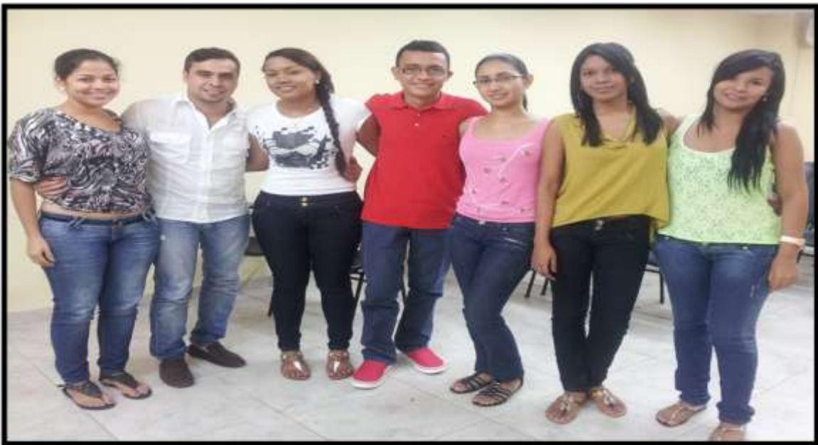
Foto 15. Primera Cohorte del Semillero de Investigación en Sociedad, Derecho y Ambiente.