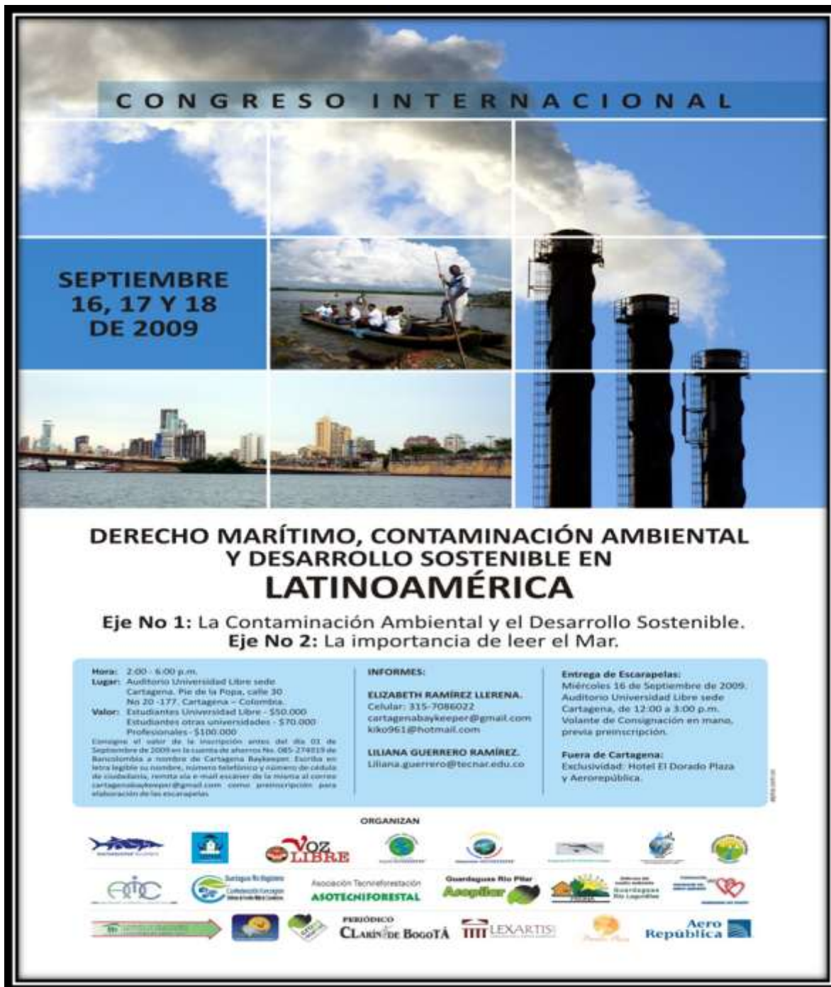
Imagen 15. Afiche del CONGRESO INTERNACIONAL DERECHO MARÍTIMO, CONTAMINACIÓN AMBIENTAL Y DESARROLLO SOSTENIBLE EN LATINOAMÉRICA, 2009.