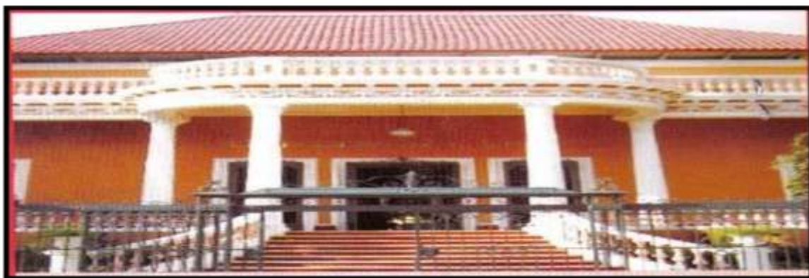
Foto 12. El Semillero de Investigación en Sociología Jurídica e Instituciones Políticas – SEMISOJU, investiga en la Universidad Libre Sede Cartagena, en la ciudad de Cartagena de Indias, Colombia.

Qué importante es para la comunidad estudiar su geografía, su clima, sus recursos naturales, su ubicación dentro de las coordenadas del país y del mundo. Ubicarse desde niño en su espacio físico, da consistencia a los ideales, al futuro, a la realización plena de la vida en el aquí. Cuánto pueden enseñar al respecto, las culturas indígenas sobre el amor y respeto por las aguas, por las plantas, por los animales, por la naturaleza en general, a una sociedad actual caracterizada por lo sobrenatural mal entendido, por lo aparente, por lo antinatural, por la destrucción de la naturaleza, por la contaminación de las aguas y del aire, por la tala indiscriminada de los árboles, por el irrespeto a la vida. Consideramos de suma importancia el contexto espacial de un semillero porque es allí donde este investiga. Ejemplo de CONTEXTO ESPACIAL DE LOS SEMILLEROS DE INVESTIGACIÓN. El lugar donde los estudiantes de Derecho que ingresan al Semillero de Sociología Jurídica e Instituciones Políticas – SEMISOJU, es la Universidad Libre Sede Cartagena.