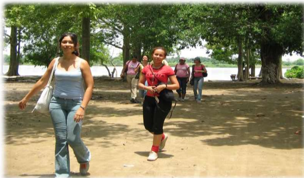
Foto 17. Estudiantes de Derecho de miembros de la Primera Cohorte de SEMISOJU en un socio jurídico trabajo de campo en Magangué, Sur de Bolívar.

Para el desarrollo de esta actividad, se realizara un Seminario Taller de Metodología de la Investigación, para los grupos de Semilleros de la Universidad Libre Sede Cartagena a fin de buscar la ilustración sobre los diferentes métodos de Investigación e Innovación.