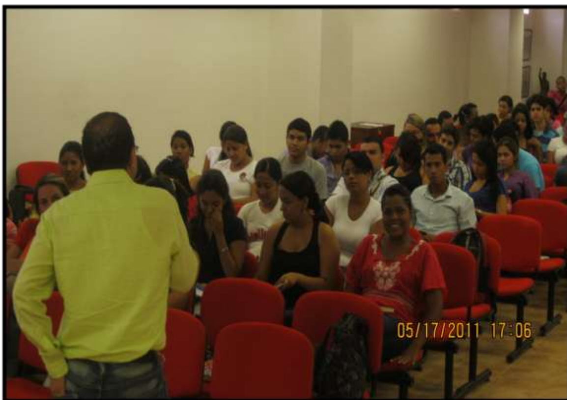
Foto 23. Estudiantes del Semillero SEMISOJU en una Conferencia en el Auditorio Benjamín Herrera de la Universidad Libre Sede Cartagena, 2011.

Los estudiantes del Semillero de Investigación SEMISOJU, han colaborado en la organización de eventos internacionales, tales como: CONGRESO INTERNACIONAL de DERECHO MARÍTIMO, CONTAMINACIÓN AMBIENTAL Y DESARROLLO SOSTENIBLE EN LATINOAMÉRICA