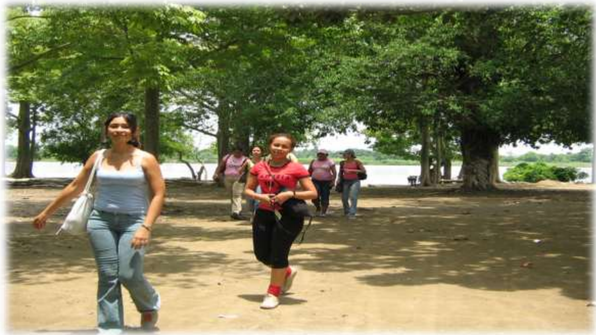
Foto 13. Primera Cohorte del Semillero de Investigación en Sociología Jurídica e Instituciones Políticas – SEMISOJU, investigando en Magangué, Bolívar.

Un semillero de investigadores es un grupo pequeño de investigadores novicios, generalmente niños o jóvenes, con carácter institucional, con mayor libertad y autonomía en sus procesos investigativos pero que pertenecen de hecho a una institución. Los grupos de investigación y los semilleros de investigadores buscan primordialmente la investigación específica pero se forman por el mismo hecho en el sentido de la investigación.