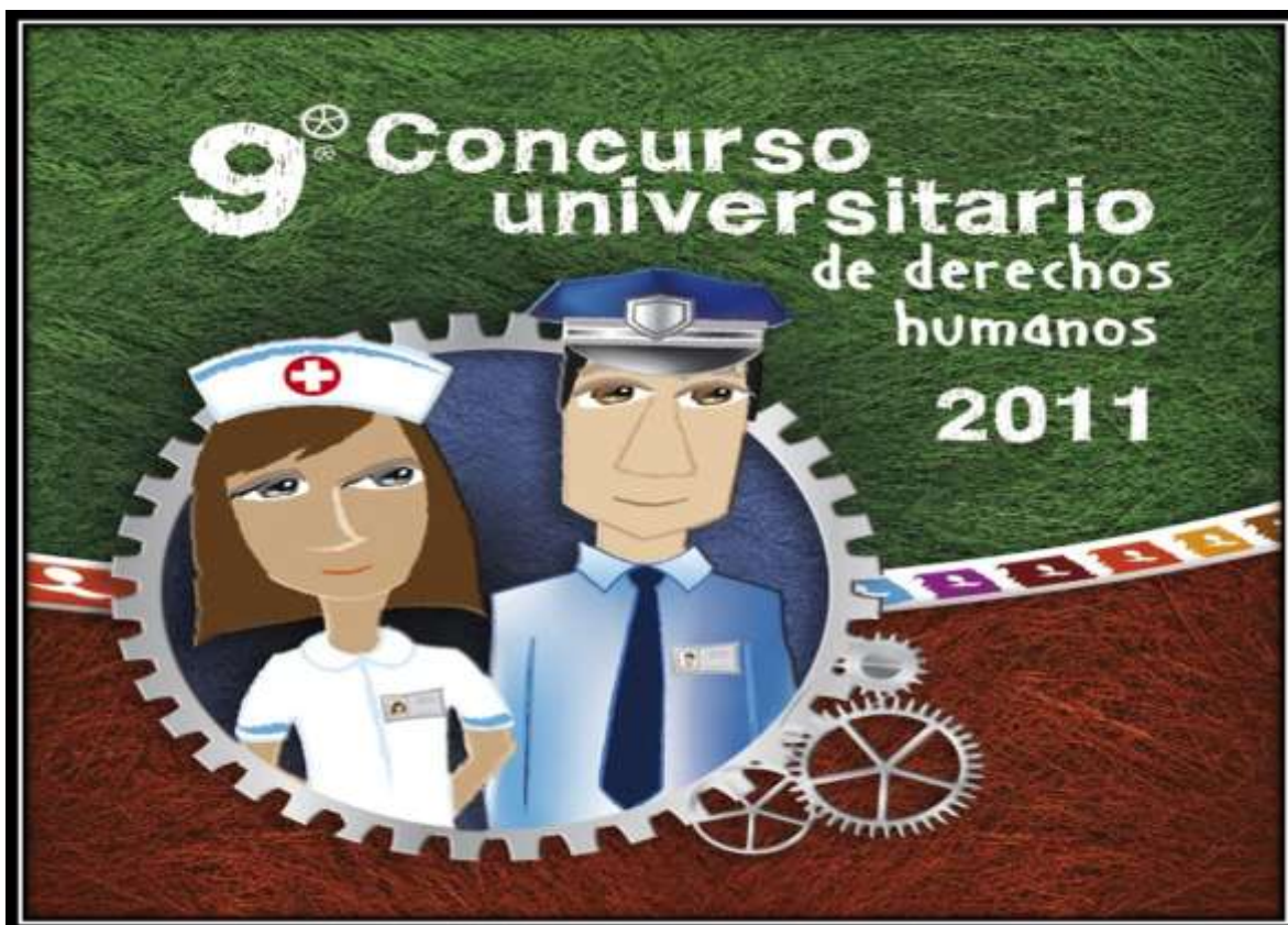
Imagen 16. Afiche del Concurso Universitario de Derechos Humanos de la Defensoría del Pueblo y la USAID, 2011.

Los estudiantes integrantes de SEMISOJU han participado en el Concurso Universitario de Derechos Humanos que organizan la Defensoría del Pueblo y la USAID.