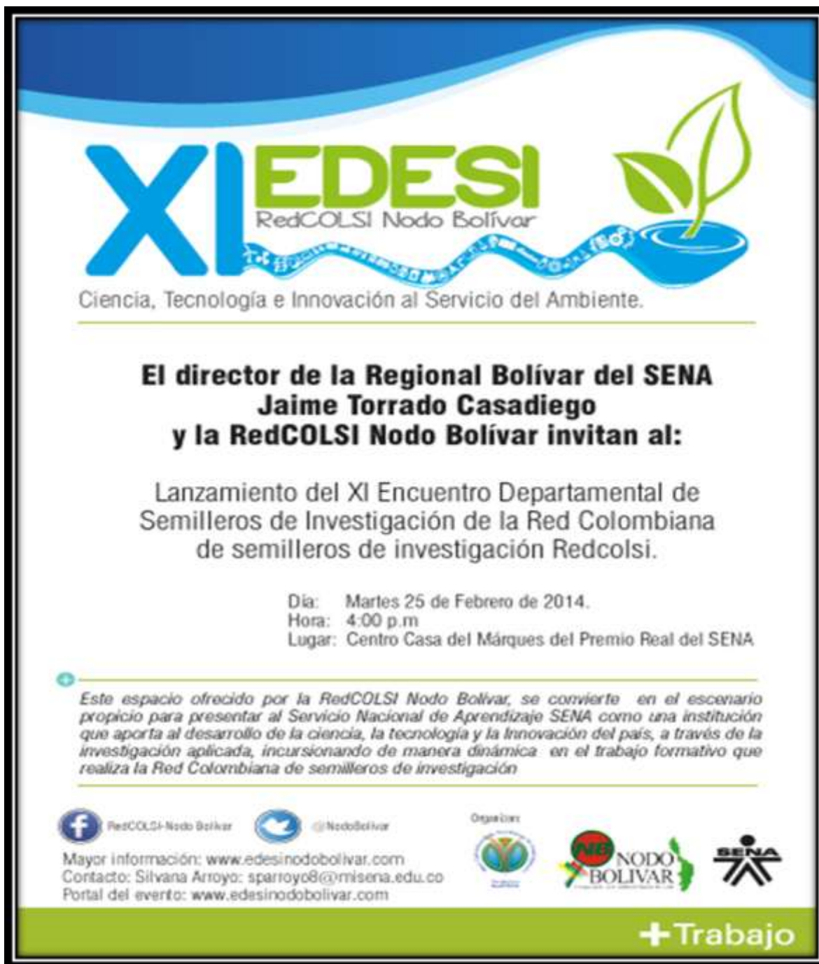
Imagen 6. Afiche XI Encuentro Departamental de Investigación del Nodo Bolívar de la Red Colombiana de Semilleros de Investigación RedCOLSI, 2014.