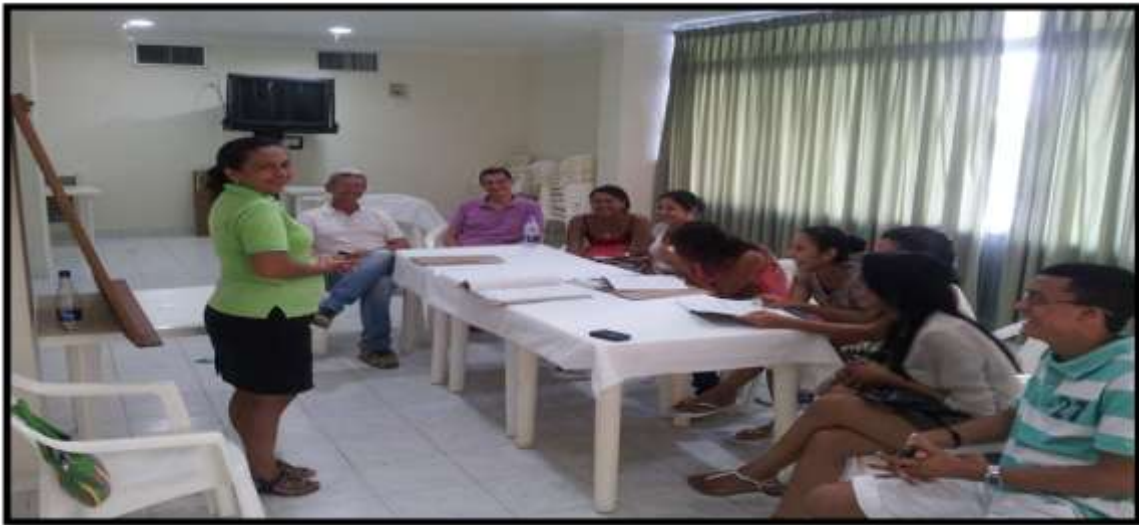
Foto 20. Estudiantes del Semillero SEMISOJU de la Línea Sociedad, Ambiente y Derecho haciendo un trabajo de campo en el barrio El Laguito.