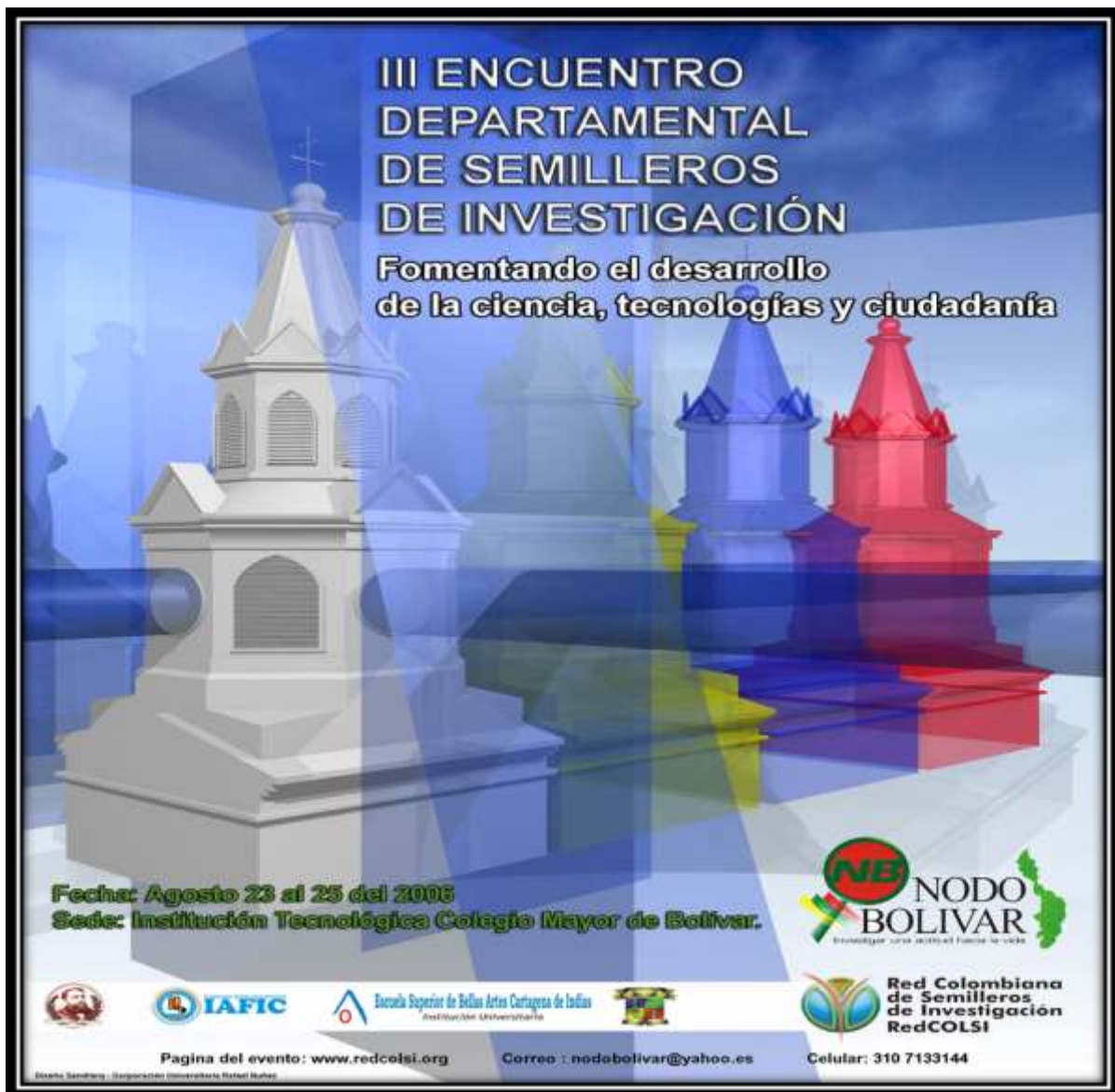
Imagen 2. Afiche del III Encuentro Departamental de Investigación del Nodo Bolívar de la Red Colombiana de Semilleros de Investigación RedCOLSI, 2006.

Semilleros del Departamento. Los SEMILLEROS DE INVESTIGADORES a nivel Local aparecen como espacios de concertación para que entre todos se construya el desarrollo de la localidad. Desde este momento SEMISOJU ha participado en los siguientes Encuentros Departamentales de Investigación.