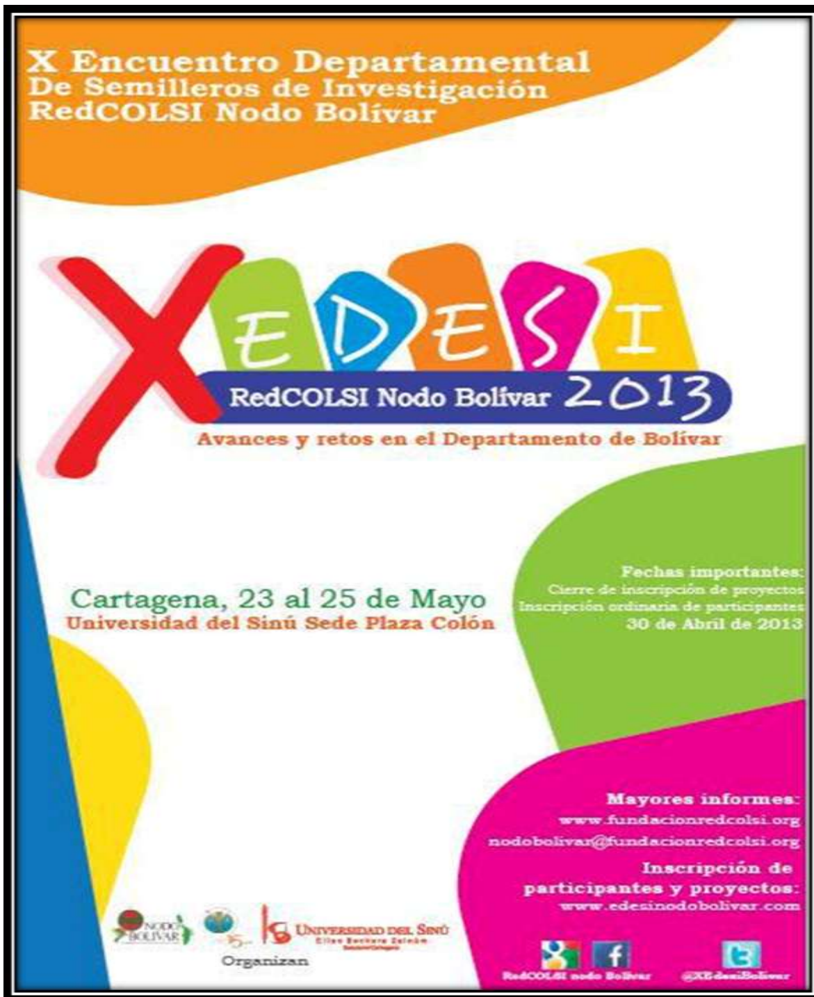
Imagen 5. Afiche X Encuentro Departamental de Investigación del Nodo Bolívar de la Red Colombiana de Semilleros de Investigación RedCOLSI, 2013.