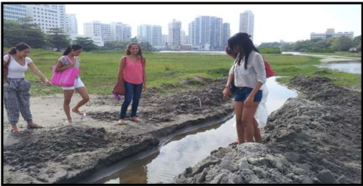
Foto 21. Estudiantes del Semillero SEMISOJU de la Línea Sociedad, Ambiente y Derecho, haciendo un recorrido como trabajo de campo en el cuerpo de agua contaminado del barrio El Laguito, de Cartagena.