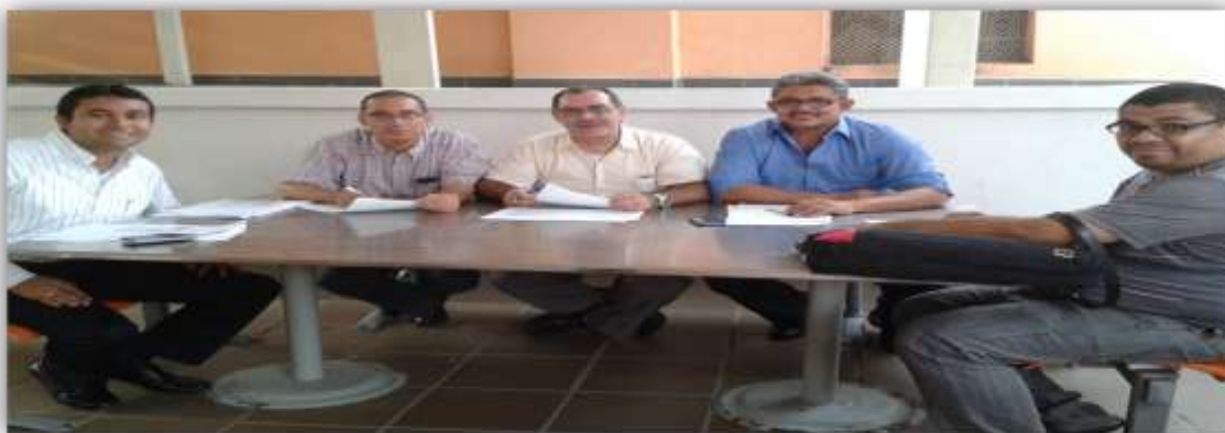
Foto 39. Docentes evaluando a las estudiantes que se inscribieron para participar en el Concurso Universitario de Derechos Humanos de la Defensoría del Pueblo y la USAID, año 2014.

Preparando al equipo del año 2015 que participó en el Concurso Universitario de Derechos Humanos de la Defensoría del Pueblo y la USAID.