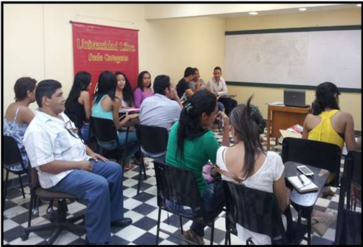
Foto 1. Reunión de Semilleros de Investigación de la Universidad Libre Sede Cartagena, con el Coordinador de Semilleros, 2013.

La integración de la Red Interna de Semilleros de investigación de la Universidad Libre se materializa en la Semana de Investigación. Veamos: