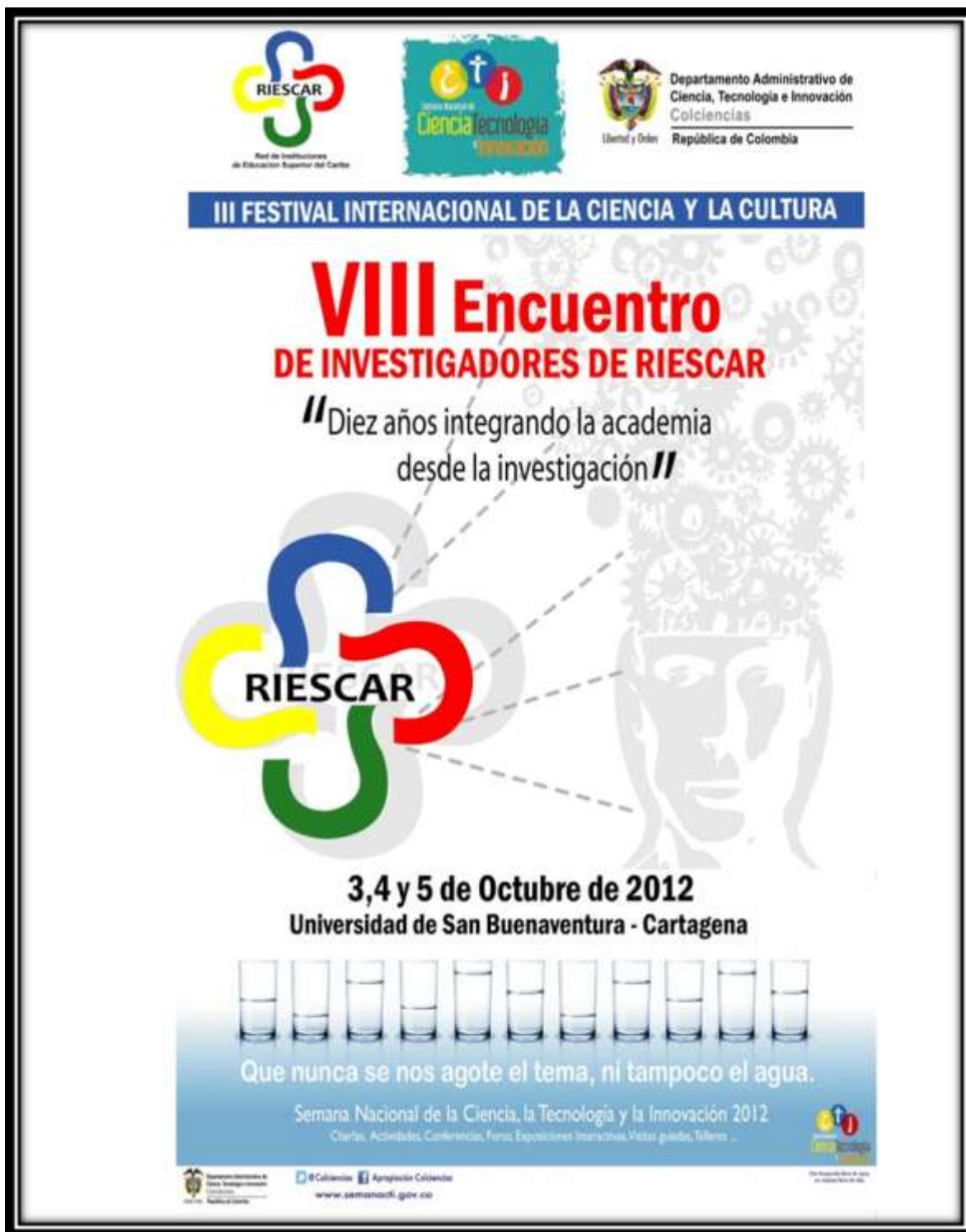
Imagen 10. Afiche del VII Encuentro de Investigadores de la Red RIESCAR, 2012.