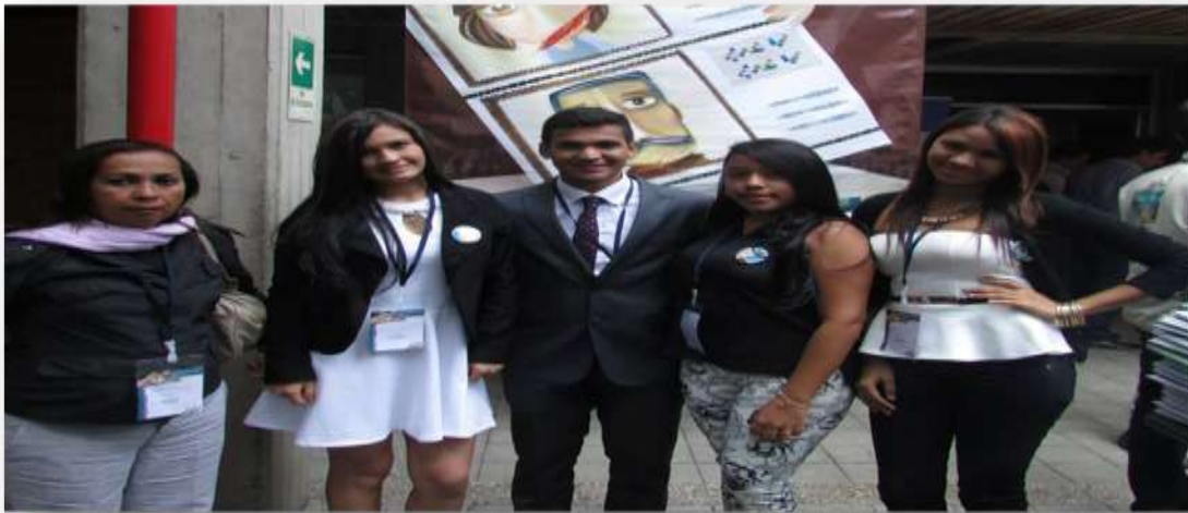
Foto 35. Equipo de la Universidad Libre Sede Cartagena en el Concurso Universitario de Derechos Humanos de la Defensoría del Pueblo y la USAID, Año 2014.