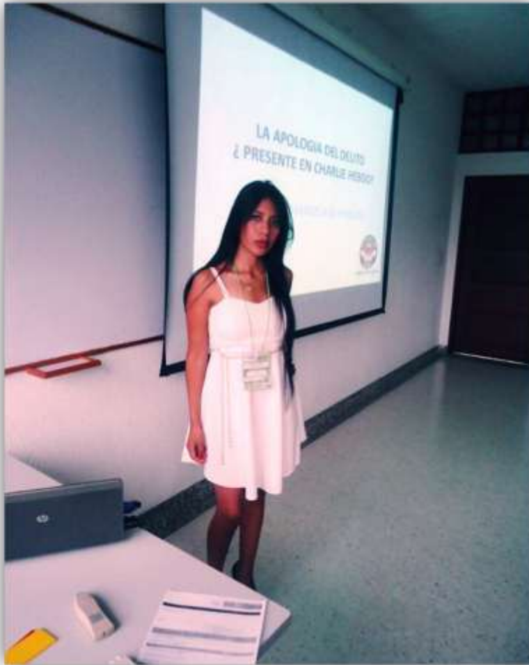
Foto 16. Primera Cohorte del Semillero de Investigación en Derecho Penal y Criminología.