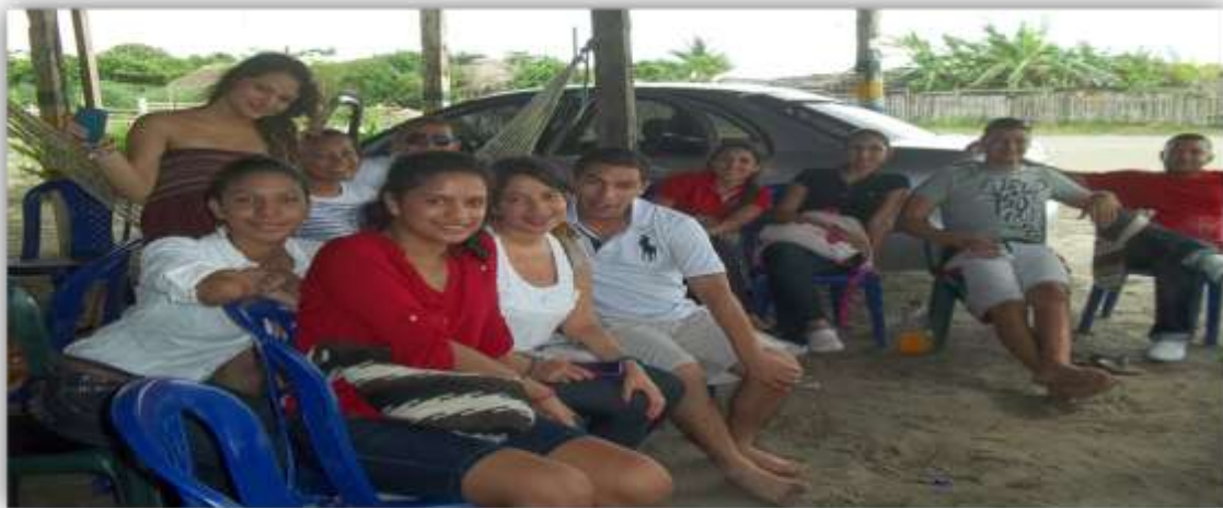
Foto 19. Estudiantes del Programa de Derecho celebrando con una actividad en la Boquilla, LA SEMANA NACIONAL DE LA CIENCIA, LA TECNOLOGÍA Y LA INNOVACIÓN, año 2012.