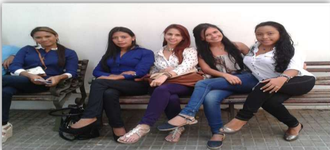
Foto 40. Estudiantes que se inscribieron para participar en el Concurso Universitario de Derechos Humanos de la Defensoría del Pueblo y la USAID, año 2014.