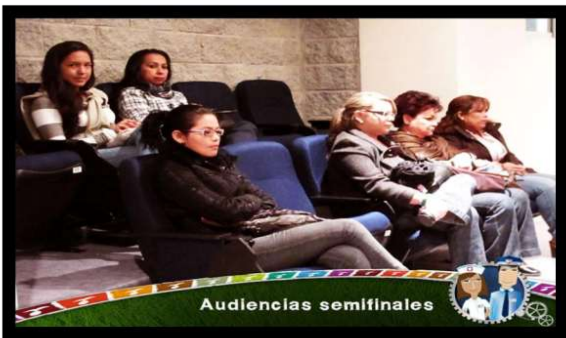
Foto 32. Observando las Audiencias Semifinales en el Concurso Universitario de Derechos Humanos de la Defensoría del Pueblo y la USAID, Año 2011.