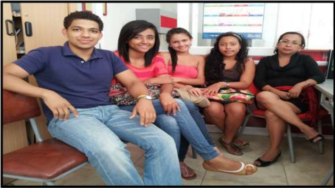
Foto 14. Primera Cohorte del Semillero de Investigación en Derechos Humanos.