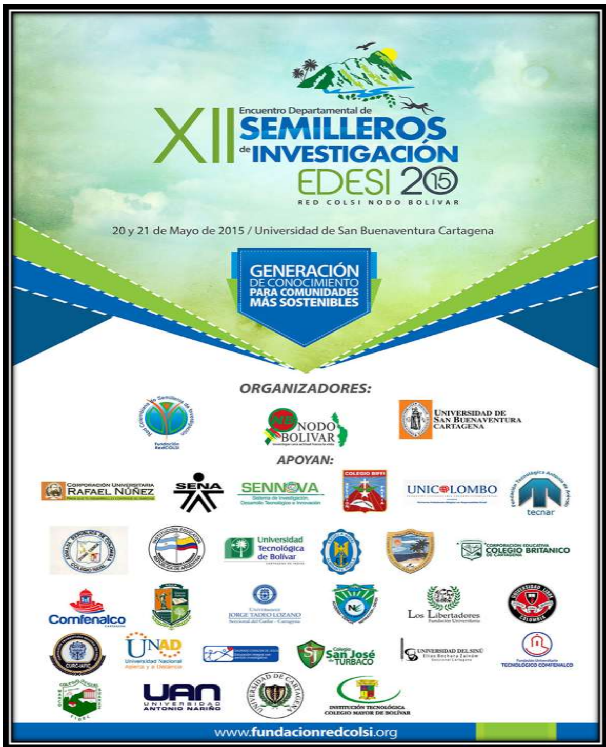
Imagen 7. Afiche XII Encuentro Departamental de Investigación del Nodo Bolívar de la Red Colombiana de Semilleros de Investigación RedCOLSI, 2015.