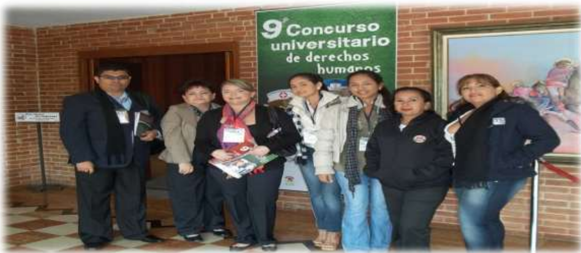
Foto 33. Equipo de la Universidad Libre Sede Cartagena en el Concurso Universitario de Derechos Humanos de la Defensoría del Pueblo y la USAID, Año 2011.