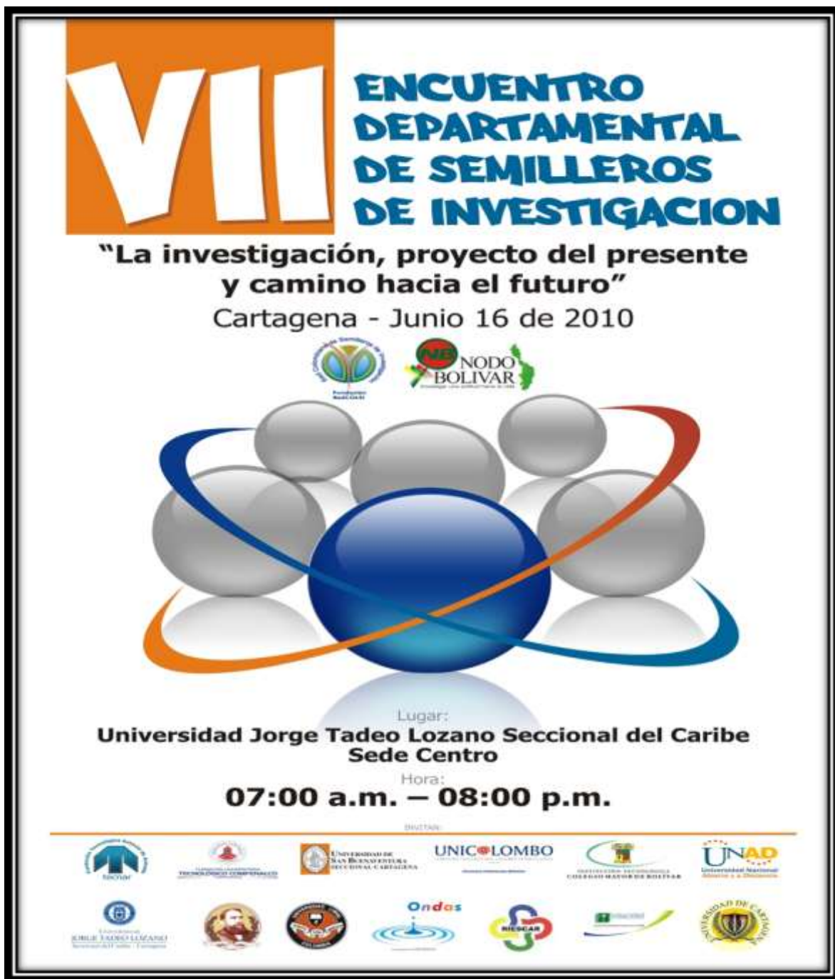
Imagen 3. Afiche VII Encuentro Departamental de Investigación del Nodo Bolívar de la Red Colombiana de Semilleros de Investigación RedCOLSI, 2010.