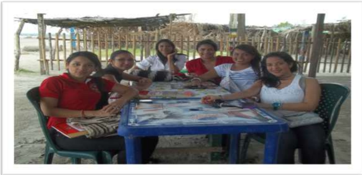
Foto 18. Estudiantes del Programa de Derecho celebrando con una actividad en la Boquilla, LA SEMANA NACIONAL DE LA CIENCIA, LA TECNOLOGÍA Y LA INNOVACIÓN, año 2012.