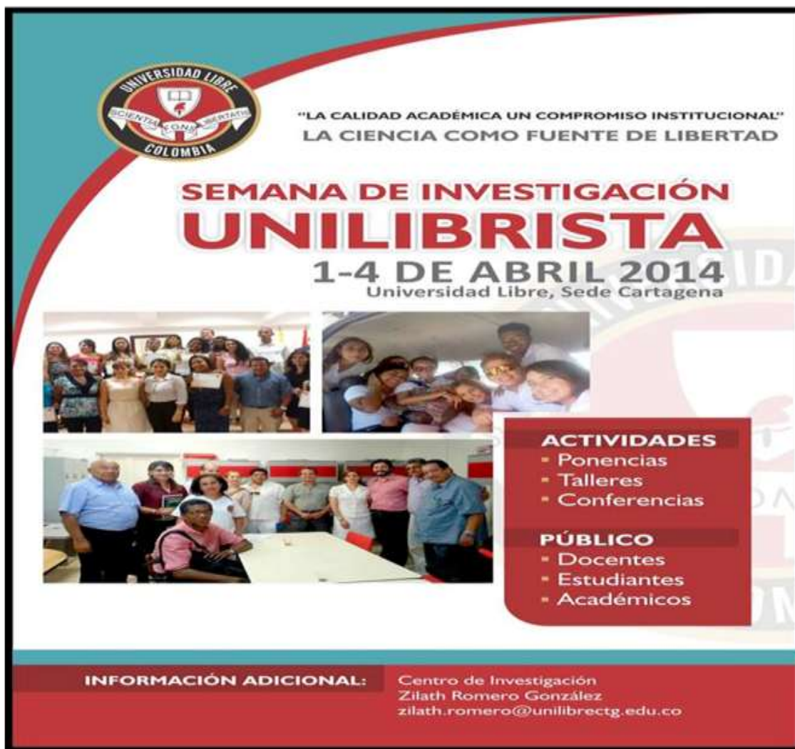
Imagen 1. Afiche de la Semana de Investigación UNILIBRISTA, 2014.